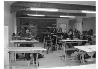
Elèves au travail

➔ Elles visent à développer chez l'élève des aptitudes complémentaires indispensables à une réussite ultérieure :