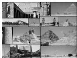
Merveilles du Monde