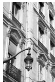
Paris au 19 ème siècle